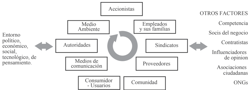
Figura 3: Radio de acción de los multistakeholders .